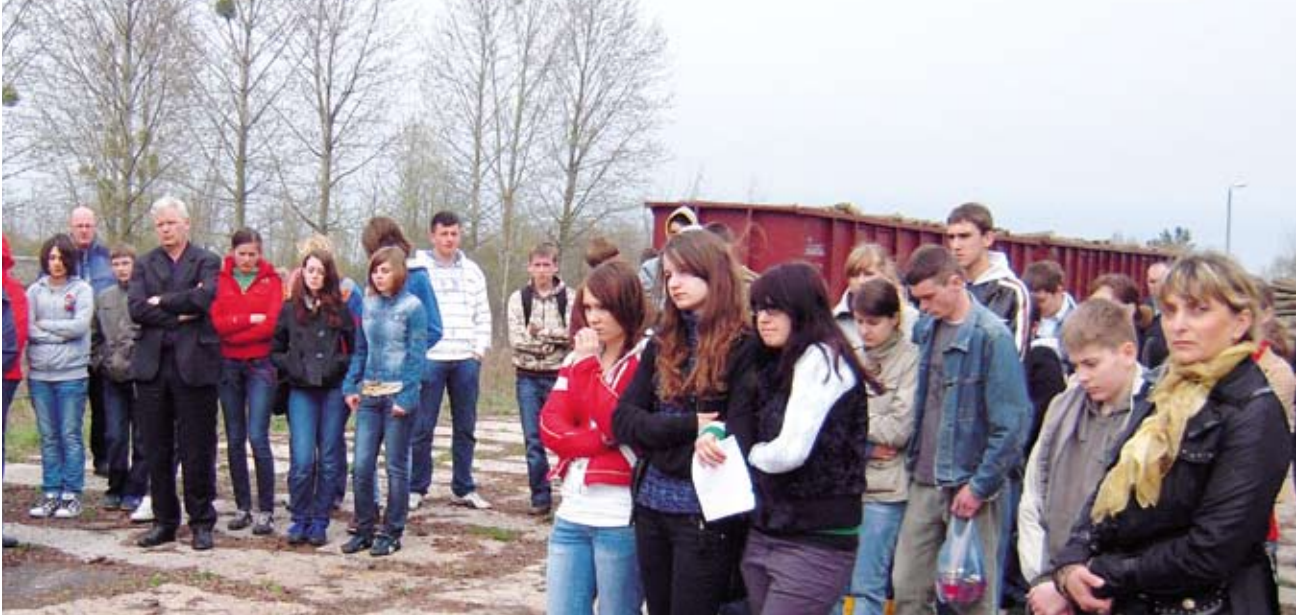
Poolse scholieren op het station van Orchowek luisteren naar een ooggetuigenverhaal