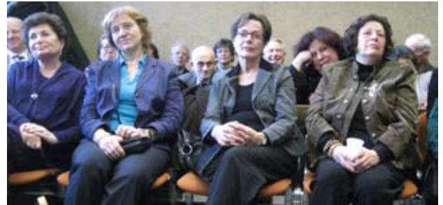
Mede-aanklagers en begeleiders tijdens een overleg met de advocaten