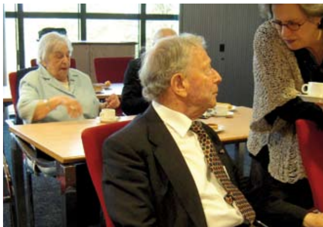
Eerste bijeenkomst van mede-aanklagers, toen nog maar acht.