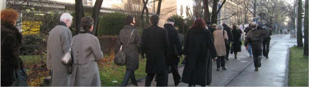
Mede-aanklagers en begeleiders op weg naar de rechtszaal