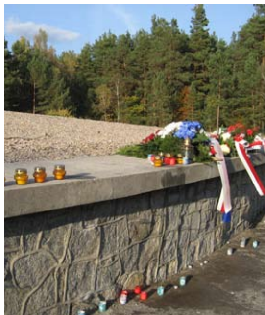
De ashevel in Sobibor