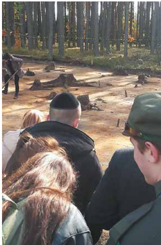
Opgravingen in Sobibor