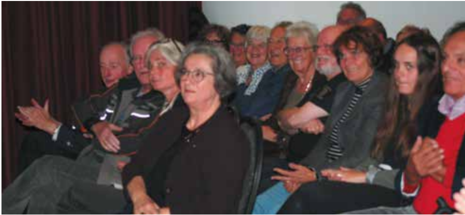
Net als voorgaande jaren een enthousiast en betrokken publiek