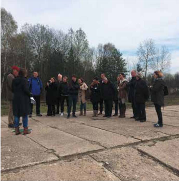
Op veel verschillende plekken wordt stilgestaan bij de gebeurtenissen uit het verleden