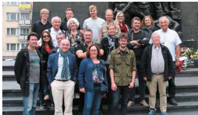
Het reisgezelschap poseert voor het monument van de Joodse opstand in Warschau.