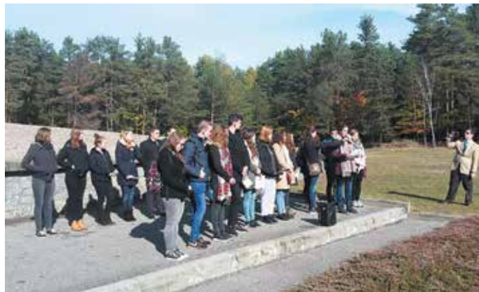
Namen lezen bij de asheuvel in Sobibor

Toen we aankwamen bij Majdanek merkte je gelijk de kille sfeer die er hing. Bij de receptie kon je uitkijken over het eerste deel van het kamp. Je zag de wachttorens, het dubbele prikkeldraad (wat vreemd genoeg heel laag leek) en de barakken. Even later liepen we verder door naar de barakblokken. Onderweg stopten we bij het monument van Majdanek, wat volgens mij helemaal bij de sfeer paste; een grote hoge betonblok met grillige vormen/letters, wat de kille sfeer benadrukte. Na het monument kwamen we aan bij een plek in een barakblok, waar de net aangekomen gevangenen zich moesten uitkleden. Daar waren ze, zoals de SS'ers het noemden, bij het 'economische deel'. Nadat de mensen zich hadden uitgekled,