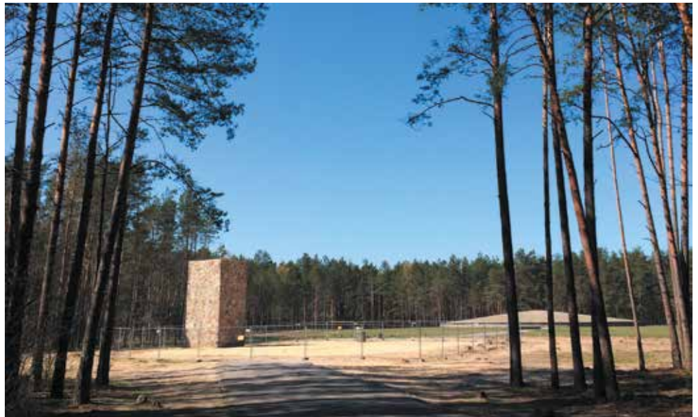
Afgeschermd fundamente van de gaskamers met op de achtergrond asvelden en asheuvel, voorjaar 2016

Voorts heeft de Poolse overheid toegezegd dat zodra het museum geopend wordt weer gedenkstenen voor de slachtoffers gelegd kunnen worden in de nieuwe Gedenkklan. De Stichting Sobibor is bijzonder verheugd dat de mogelijkheid tot stenenplaatsing is herbevestigd.