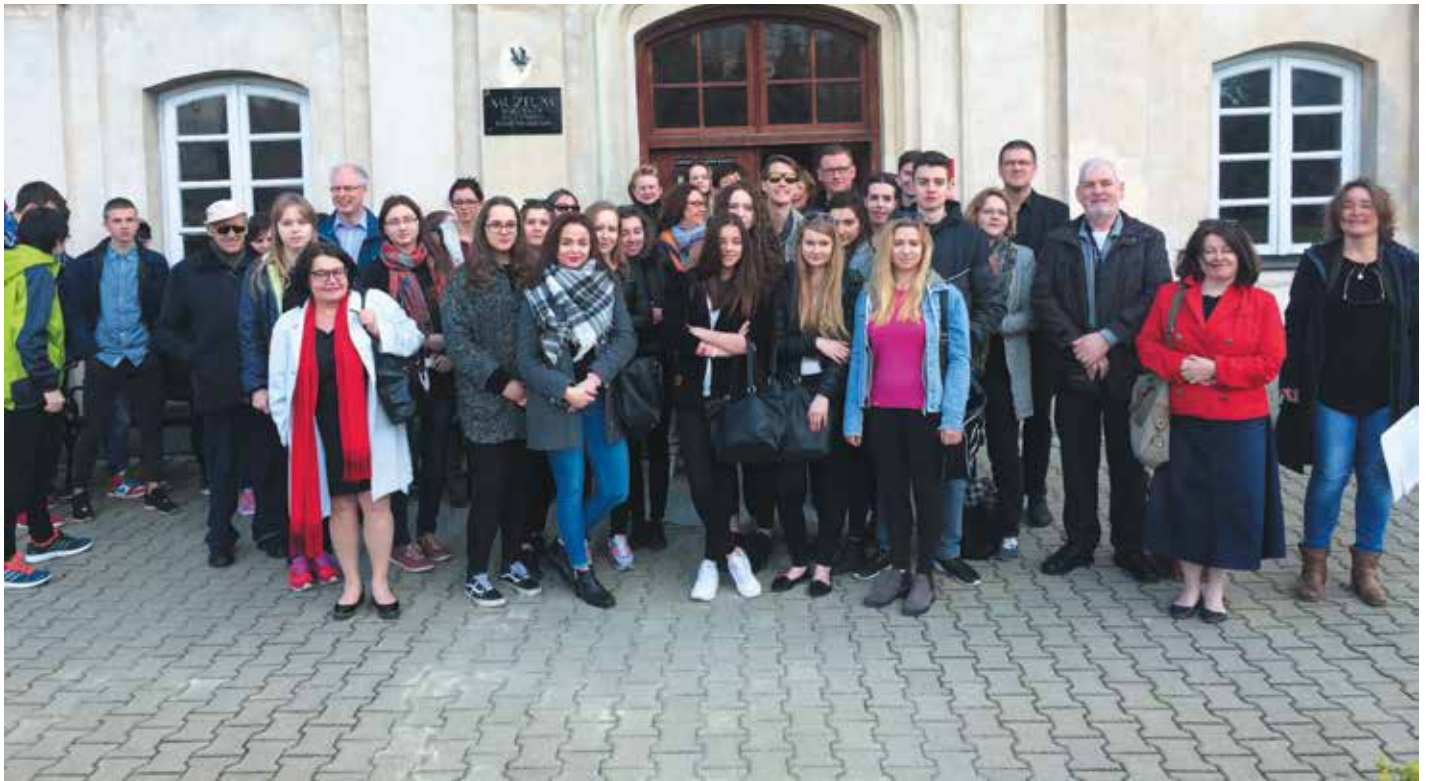
Groepsfoto Herdenkingsreis 2016 met de Poolse leerlingen