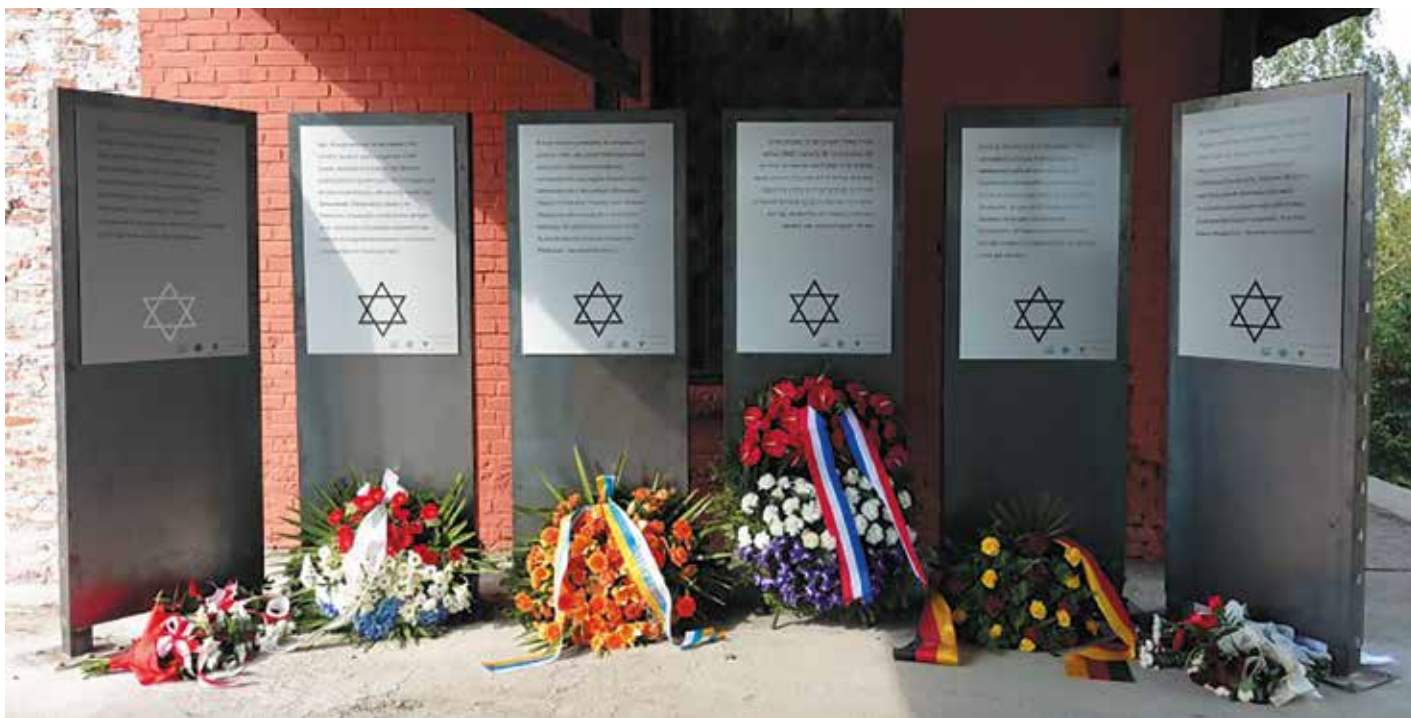
Het monument in Cosel bestaat uit zes plaquettes (in het Frans, Engels, Duits, Nederlands, Hebreeuws en Pools) op het perron van het goederenstation.