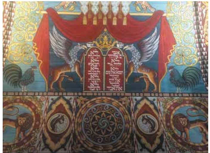
Fragment van het geschilderde plafond van de houten nagebouwde synagoge in het Polin Museum, Warschau

In de bus tijdens het tweede bezoek aan Sobibor werd de groep vergezeld door een twintigtal scholieren van een Lublinse middelbare school. Met korte impressies van de Joodse bewoners van Lublin namen ze deel aan de herdenking. Op deze wijze