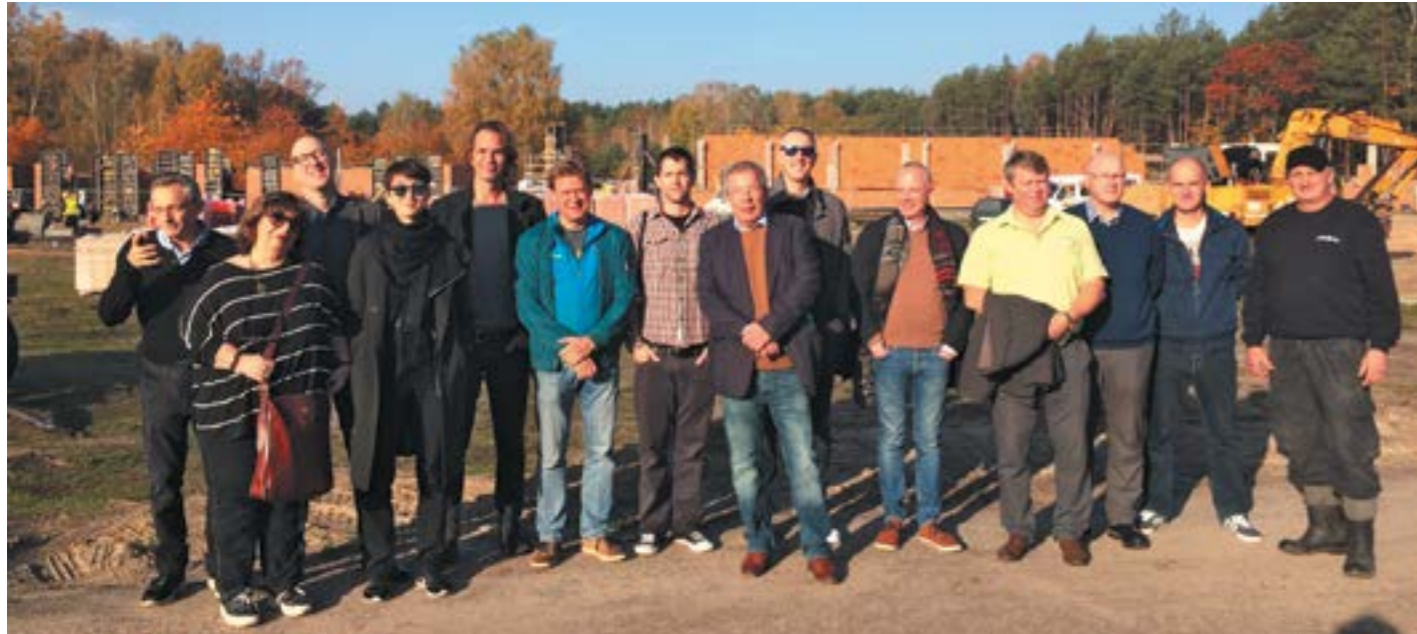
Vertegenwoordigers uit Israël, Slowakije en Nederland zijn in Sobibor om te praten over de voorstellen voor de inrichting van de permanente tentoonstelling