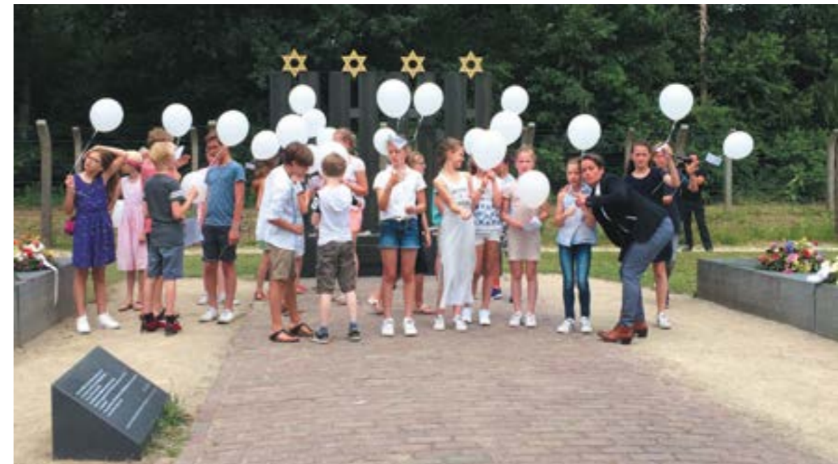
Jaarlijkse herdenking Kindertransporten Vught