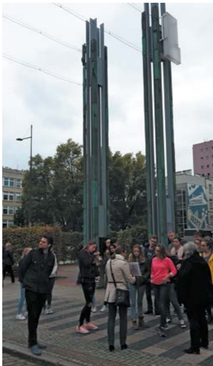
De jongeren krijgen uitleg over het getto van Warschau

's Avonds was er tijd voor ontspanning en gaven alle jongeren een presentatie over hun land. Vooral de Oekraïense presen-