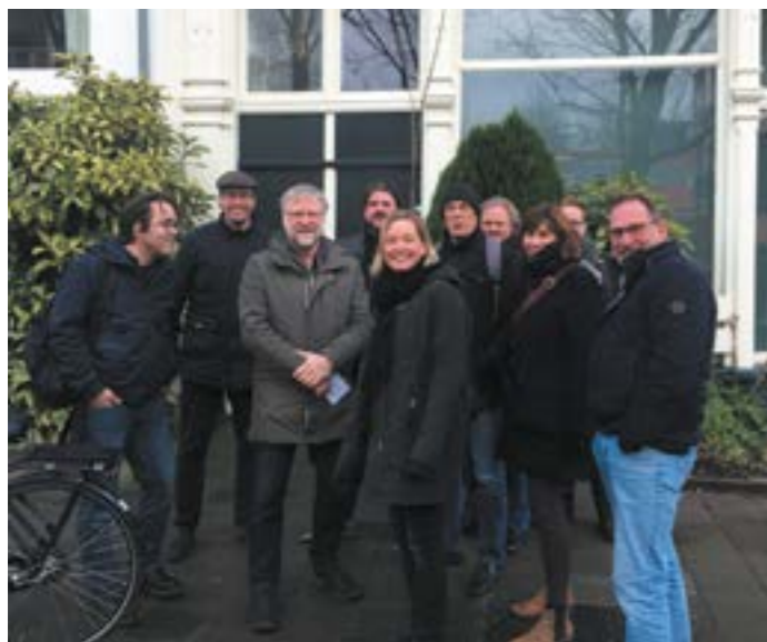
Docenten en begeleiders tijdens de studiedag in het kader van het docentenprogramma

Als onderdeel van het docentenprogramma vond twee maanden na de Verdiepingsreis een studiedag plaats. Was er tijdens