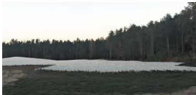
De asvelden zijn afgeschermd

In het voorjaar is een eerste stap gezet in de herinrichting door de asvelden te bedekken met een 20 centimeter dikke laag stenen. De asvelden zijn nu beschermd en men hoeft niet meer bang te zijn om botscherven in het gras tegen te komen. Ook mensen die picknicken op het grasveld is verleden tijd. Het is nu niet meer mogelijk om tot aan de asheuvel te lopen zoals dat eerder wel kon. Het resultaat is indrukwekkend.