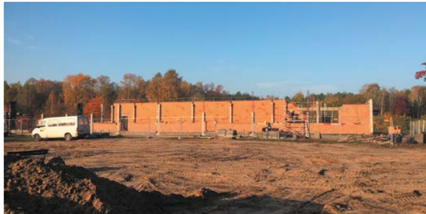
In 2017 is begonnen met de bouw van het museum