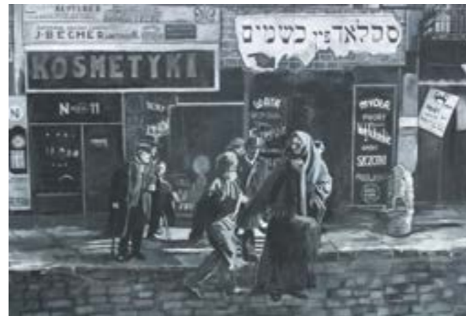
Graffiti in Lublin waarmee duidelijk wordt hoe de Joodse wijk er uitzag.

In Piaski is de Joodse begraafplaats overwoekerd en zijn grafstenen weggehaald. Een Amerikaanse organisatie probeert in dit gebied anonieme graven met een kleine houten grafzerk te markeren. Ook hier staat er één; een stille getuige van de