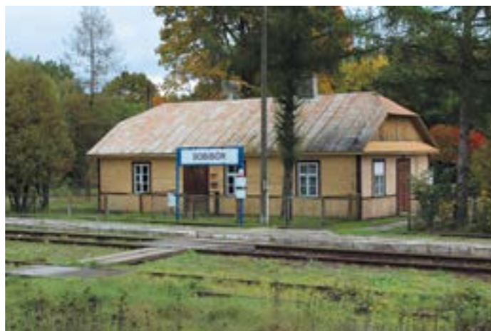
Het station op voormalig kampterrein Sobibor.