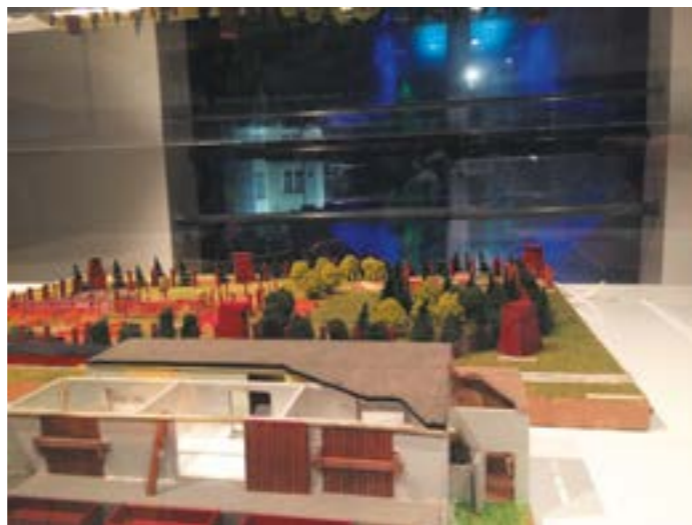
Maquette van Sobibor: onderdeel van de proefopstelling in het NHM

Een publieksonderzoek maakte deel uit van de proefopstelling. Aan de hand van verschillende representaties wilde het NHM i.o. in gesprek met bezoekers en geïnteresseerden om inzicht te krijgen in hun wensen en ideeën over een museale weergave van Sobibor.