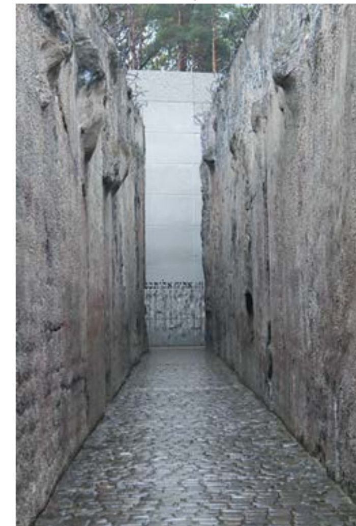
De stenen muur van het monument in Belzec wordt steeds hoger; de tunnel steeds donkerder.

textielwerkplaats. In Majdanek daarentegen staan nog veel van de barakken en gebouwen overeind. Mede omdat al kort na de oorlog werd besloten hier een museum van te maken. Gidsen van het museum leidden de groep rond. Het was een confronterende dag.