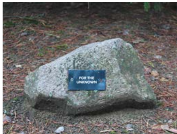
Een van de vele gedenkstenen.

Despite the cancellation of the Commemoration Trip we took the time to travel to Sobibor ourselves and see for ourselves how the construction was going. We were impressed by the respect that was shown by the workers and to see that the stones were manually spread over the ash fields with wheelbarrows. Polish students normally join us for a day during our Commemoration Trip. Instead of them joining us, we visited them in Lublin at their school and gave them a guest class about the former extermination camp Sobibor.