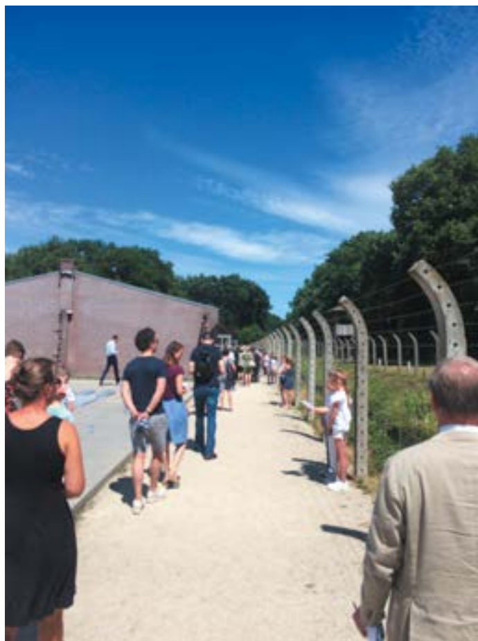
Kinderen lezen de namen voor van weggevoerde leeftijdgenootjes