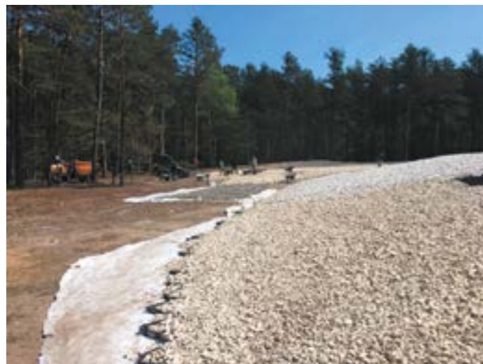
Werkzaamheden rond afscherming van de asvelden in volle gang

Het originele ontwerp was erop gericht de bezoekers te beklemmen door hen ingesloten door muren langs de fundamenteën van de gaskamers te leiden alsof je als bezoeker zelf de gaskamer ingaat. Het nu gekozen ontwerp laat dit aan de bezoeker zelf over. Voor ons als stichting is dit de juiste keuze: je moet als bezoeker zelf kunnen beslissen wat je wel en niet wilt zien of bezoeken.