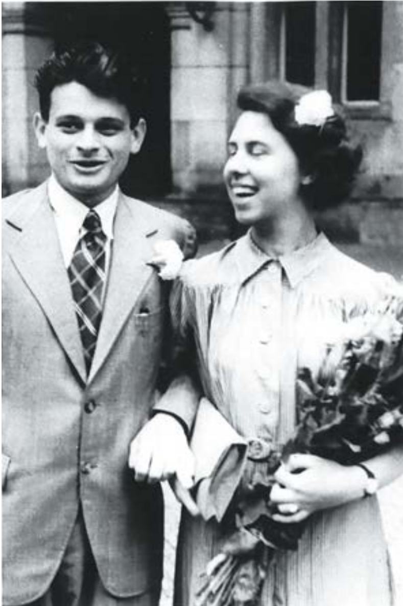
Het stralende jonge echtpaar